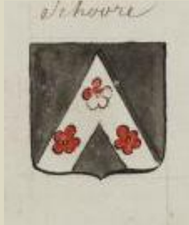
Wapenschild van de familie van Schoore, waarvan enkele leden zich heer van Dierdonk laten noemen.