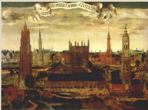
De zeven wonderen van Brugge (Claeissens). Het huis de zeven torens of het Hof van Meulebeke prijkt centraal tussen andere monumentale Brugse gebouwen en torens !