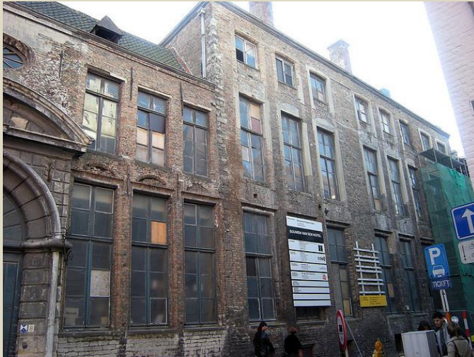
Huis de 7 Torens - Hoogstraat Brugge, voor de restauratie in 2008-2009. Vandaag Grand Hotel Casselberg.